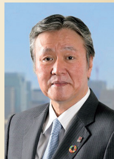
損害保険ジャパン株式会社 取締役社長